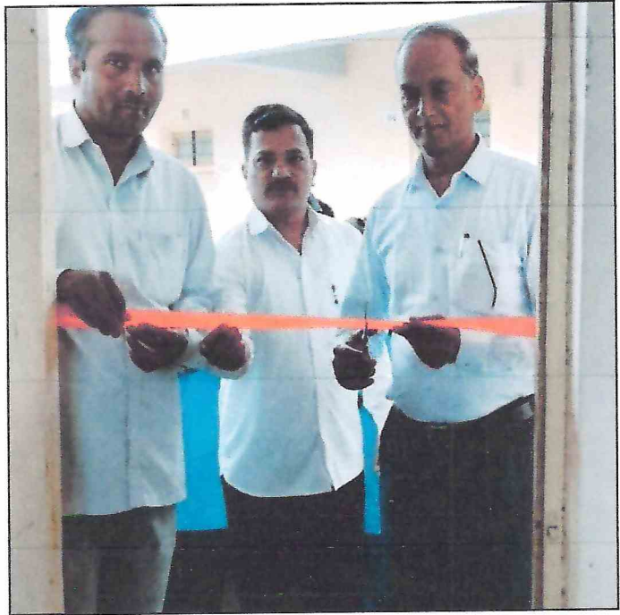
भीतीपत्रक अनावरण समारोह में प्राध्यापक एवं विद्यार्थी, दि. 07/10/2022